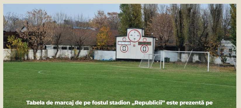
Tabela de marcaj de pe fostul stadion „Republicii” este prezentă pe

În 2023, mai există doar câteva amintiri vii ale uneia dintre cele mai marcante arene ale sportului românesc din secolul XX. Pe de-o parte, zidurile originale ale tribunei a II-a și peluzei Vest se regăsesc în interiorul curții Casei Poporului. Pe de altă parte, tabela de marcaj a fost mutată tocmai pe strada... Veseliei, în sectorul 5.