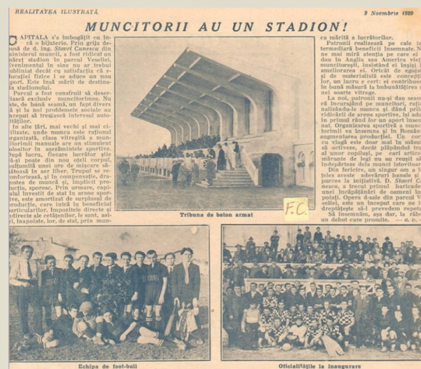
Inaugurarea stadionului „Electromagnetica”.

La doar trei zile după, pe 9 noiembrie 1929, „Capitala s-a îmbogățit cu încă o bijuterie. [...] a fost ridicat un mare stadion în parcul Veseliei”.