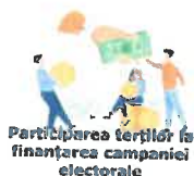
Participarea terților la finanțarea campaniei electorale

► angajatilor ELECTROMAGNETICA SA le este permisa afilierea la organizatii, asocieri sau orice alte entitati politice sau apolitice, cu indeplinirea urmatoarelor obligatii/interdictii: